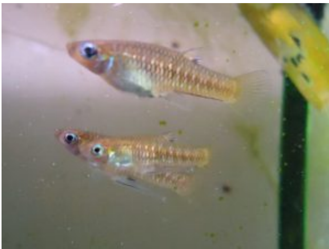
Limia heterandria - narancs límia

Tenyésztése is az elevenszülő fogaspontyoknál szokott módon zajlik, kb. havonta-másfél havonta