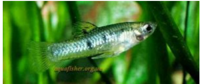
Limia heterandria - narancs límia

De akkor nézzük is e havi választottunkat, az egyeseket megviselő nyári melegre figyelemmel, egy üde kis cikkel készülök egy, a forró tájak egzotikus gyümölcsét is nevében hordozó, kedves kis halról. Ez nem más, mint a narancs límia!