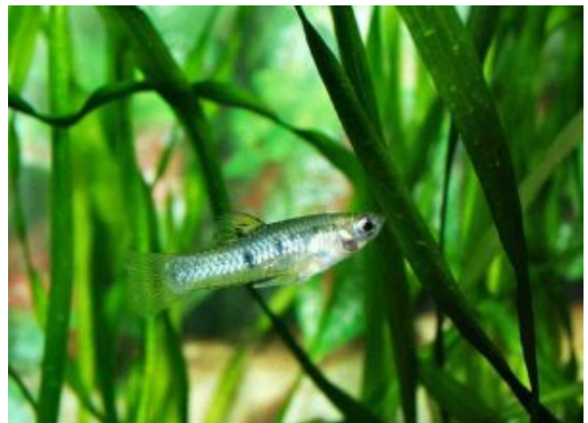
Limia heterandria - narancs límia - hím

Igen kecses, kis límiafaj. A hím 2,5, a nőstény 4,5 cm hosszúra nőhet. A hím sötét olajzöld, oldalai olajsárga színűek, a hátúszója alatt egymás mellett álló s ezüstösen csillogó keresztcsíkokkal. Hastájéka világos- vagy narancssárga. Úszói sárgák; a hátúszót két ívelt sötét szalag díszíti. A nőstényeken hiányzanak a keresztcsíkok, viszont a testoldal közepén a hátúszó alatt egy hosszanti sötét csík látható. Az úszók szintelenek vagy sárgásak; a hátúszót egy kerek fekete folt ékesíti.