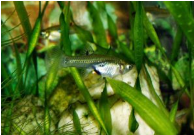
Limia heterandria - narancs límia nőstény

növényzetben. Sötétebb aljzat és úszónövények használatával további biztonságérzetet biztosíthatunk neki. Kedveli a gyakran cserélt, jól szűrt vizet, figyeljünk, hogy tartóvizének károsanyag-tartalma ne emelkedjen meg. A pH semleges közeli legyen (6-8 között), míg a német keménységi fok lehetőleg 10 és 20 között maradjon, esetleg 10-nél kicsit alacsonyabb értéket vehet fel, de túlságosan lágy vízben nem gondozható! A víz további paramétereivel szemben nem nevezhető igényesnek, kezdők számára is alkalmas fajnak mondható.