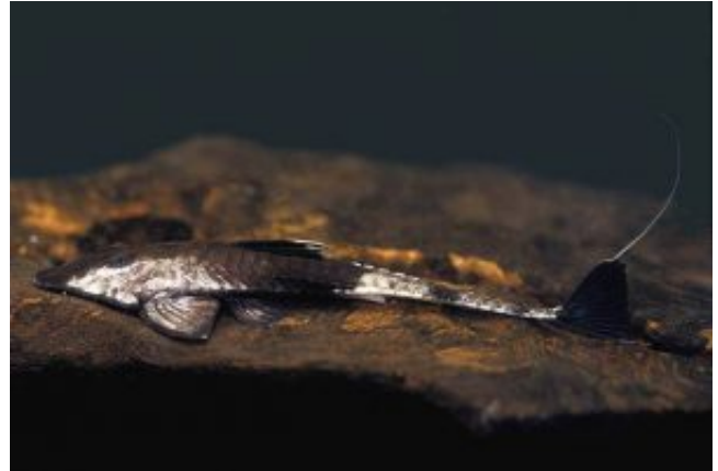
Pseudohemiodon apithanos - kaméleon vértespáncélosharcsa

A faj esetében a nagy alapterület számít igazán, medencéjét töltsük fel apró szemű sóderrel vagy kvarchomokkal, melyben kedvére beáshatja magát, sokat időz a talaj felsőbb rétegeiben mókázva. Kedveli az úszónövényes árnyékolást, a direkt megvilágítás kerülendő. A túl vékony növényeket esetleg kitérhatja, de más kártétele nem jellemző. Napközben is rendszeresen előmerészkedik, nem szigorúan éjszakai faj. Ha azt szeretnénk, hogy halaink optimálisan jól érezzék magukat, és a 8-10 éves kifejtett kori korukat elérjék, jól szűrt, oxigéndús, tiszta vízben tartsuk őket, melyben természetesen búvóhelyeket is találnak. Átlagos melegebb trópusi medence (26-27 °C) megfelel neki, melyben enyhén savas vagy semleges közeli, lehetőleg minél lágyabb vizet töltsük.