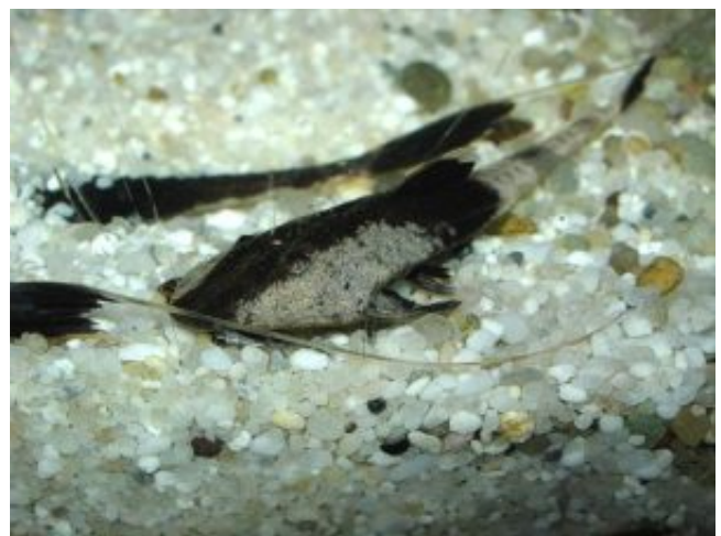
Pseudohemiodon apithanos - kaméleon

A faj esetében a nagy alapterület számít igazán, medencéjét töltsük fel apró szemű sóderrel vagy kvarchomokkal, melyben kedvére beáshatja magát, sokat időz a talaj felsőbb rétegeiben mókázva. Kedveli az úszónövényes árnyékolást, a direkt megvilágítás kerülendő. A túl vékony növényeket esetleg kitérhatja, de más kártétele nem jellemző. Napközben is rendszeresen előmerészkedik, nem szigorúan éjszakai faj. Ha azt szeretnénk, hogy halaink optimálisan jól érezzék magukat, és a 8-10 éves kifejtett kori korukat elérjék, jól szűrt, oxigéndús, tiszta vízben tartsuk őket, melyben természetesen búvóhelyeket is találnak. Átlagos melegebb trópusi medence (26-27 °C) megfelel neki, melyben enyhén savas vagy semleges közeli, lehetőleg minél lágyabb vizet töltsük.