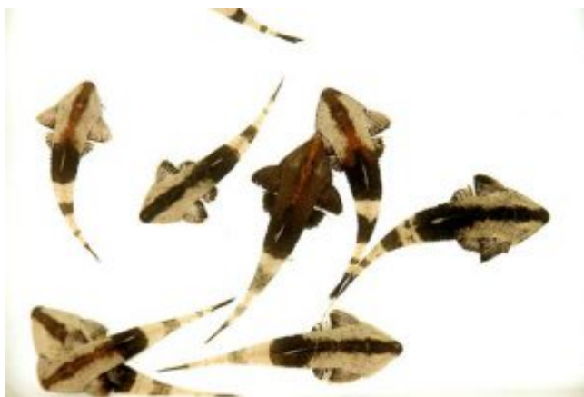
Pseudohemiodon apithanos - kaméleon vértespáncélosharcsa

Kaméleon vértesharcsa - Pseudohemiodon apithanos adattábla: