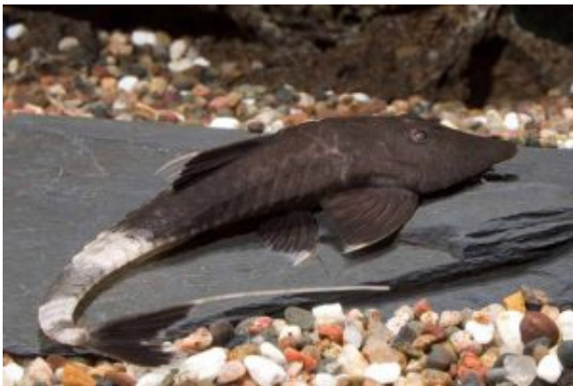
Pseudohemiodon apithanos - kaméleon vértespáncélosharcsa