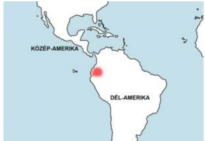
Kaméleon vértesharcsa - Pseudohemiodon apithanos elterjedési területe (distribution map)