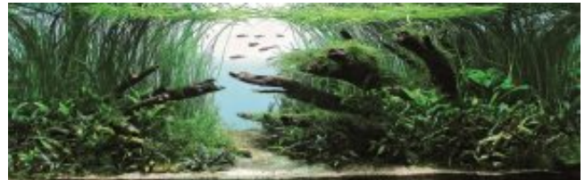
8. helyezett: Long Tran Hoan - Vietnám

A 6. helyezésre érdemes installációt a Chen/Sheng (Tajvan) páros készítette: