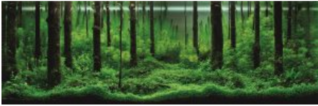
1. helyezett: Pavel Bautin - Oroszország