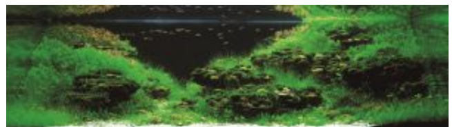
9. helyezett: K. P. Wong - Hong-Kong

A 7. helyezett Grigorij Poliscsuk (Ukrajna) egy egész kis sziklás-hegységet készített el a nézők lenyűgözése céljából: