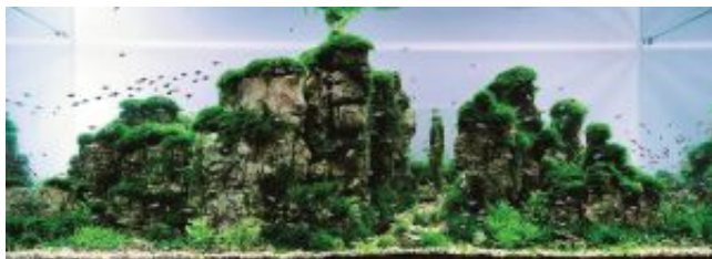
6. helyezett: Chen/Sheng - Tajvan

A 7. helyezett Grigorij Poliscsuk (Ukrajna) egy egész kis sziklás-hegységet készített el a nézők lenyűgözése céljából: