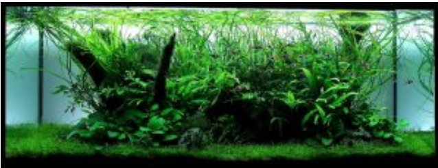
96. helyezett: Lantos Viktor - Magyarország