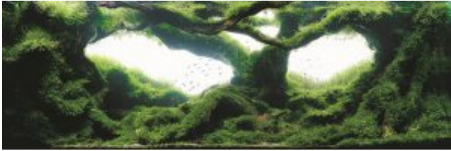
5. helyezett: Zen Qing Jun - Kína

Az 5. Zen Qing Jun Kínából, aki szintén vízalatti erdőt álmodott és valósított meg: