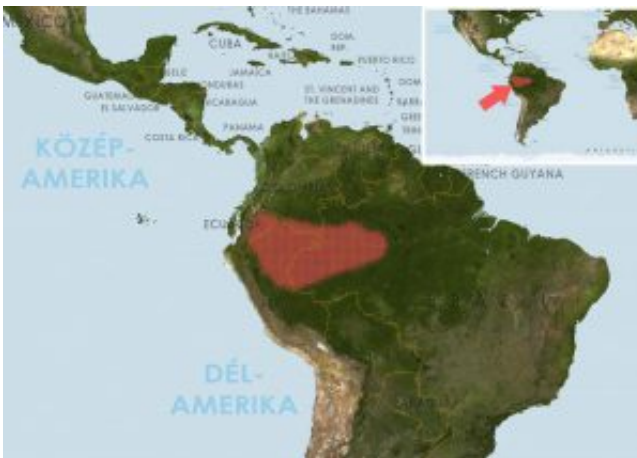
Agamyxis pectinifrons – Fehérpettyes morgóharcsa elterjedési területe (Map)

Hazája Ecuador és Peru folyói valamint az Amazonas.