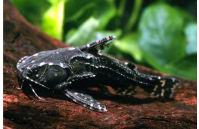
Agamyxis pectinifrons Fehérpettyes morgóharcsa (Cope, 1870)