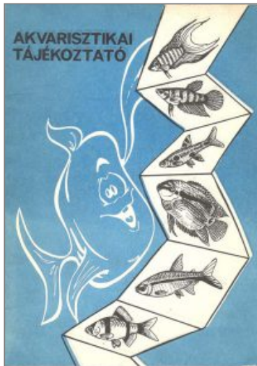
Akvarisztikai tájékoztató másik kiadása

Akvarisztikai tájékoztató Egy másik kiadás borítója