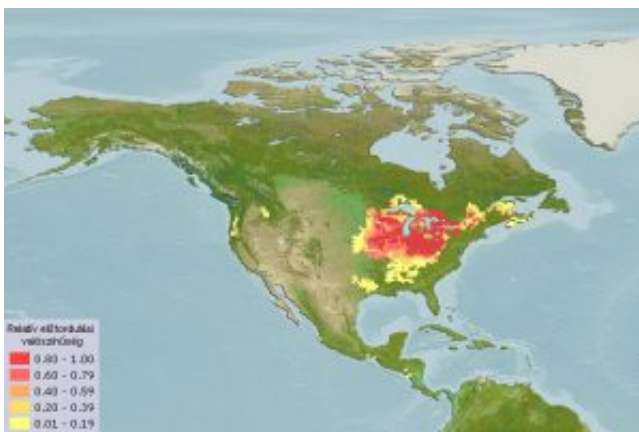
Ambloplites rupestris – Kövi sügér elterjedési területe (Map)