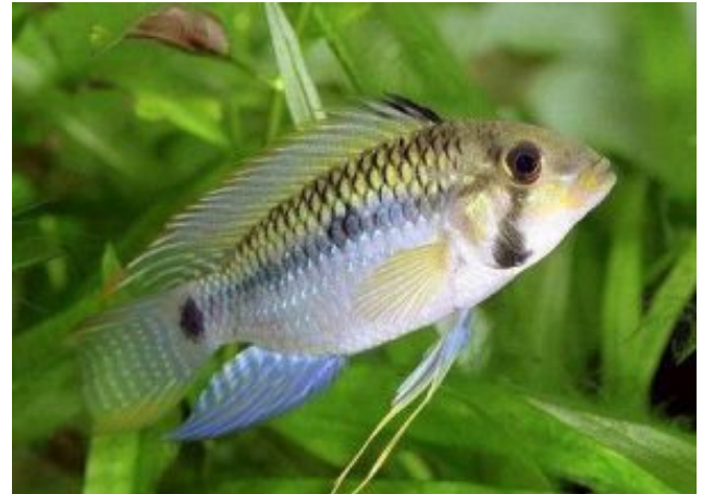
Apistogramma steindachneri Díszesszárnyú törpesügér (Regan, 1908)