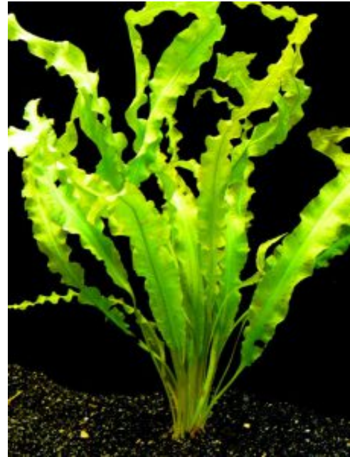
Aponogeton crispus Fodros vízikalász (Thunb.)