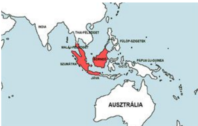
Barbodes lateristriga – Farkszalagos díszmárna elterjedési területe (Map)

Délkelet-Ázsia, Thaiföld, Malájzia, Szumátra és Jáva folyóiban és patakjaiban él.