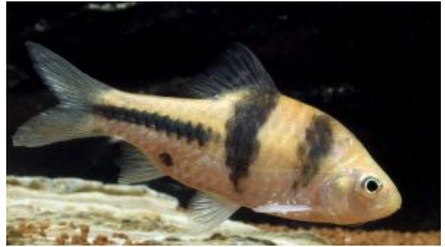
Barbodes lateristriga Farkszalagos díszmárna (Valenciennes, 1842)