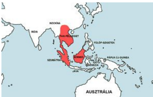
Barbonymus schwanefeldii – Tiofil díszmárna elterjedési területe (Map)

Borneó, Szumátra és Thaiföld tavai és folyói.