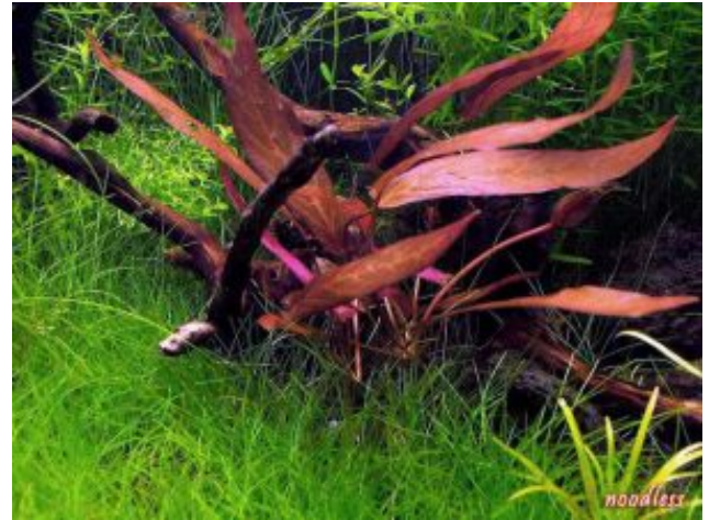
Barclaya longifolia Hosszúlevelű barclaya (Wall.)