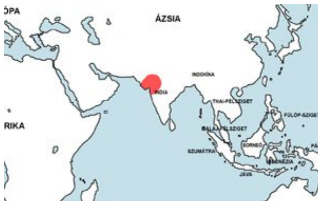
Botia lohachata – Pakisztáni díszcsík elterjedési területe (Map)