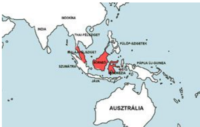
Brevibora dorsiocellata – Pettyesszárnyú razbóra elterjedési területe (Map)

Thaiföld, a Maláj-félsziget, Borneó, Szumátra és a Nagy Szunda-szigetek patakjai, folyói.