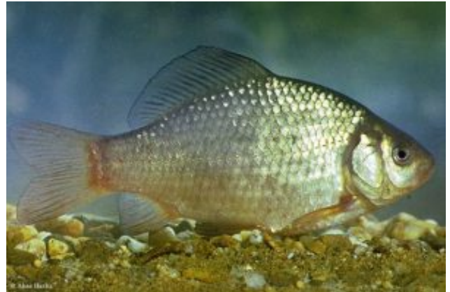
Carassius carassius Széles kárász (Linnaeus, 1758)