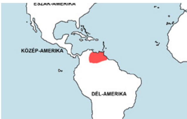
Carnegiella marthae – Törpe baltahasú lazac elterjedési területe (Map)