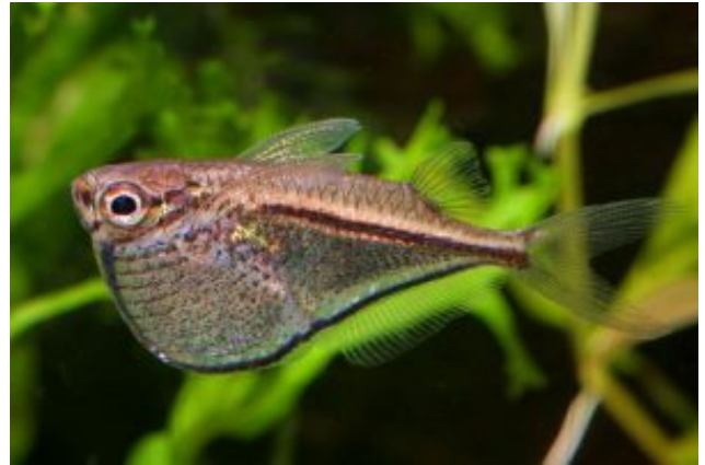
Carnegiella marthae Törpe baltahasú lazac (Myers, 1927)