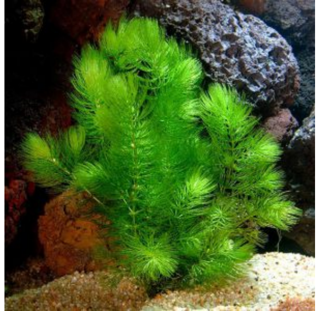
Ceratophyllum demersum Érdes tócsagaz (Linné)