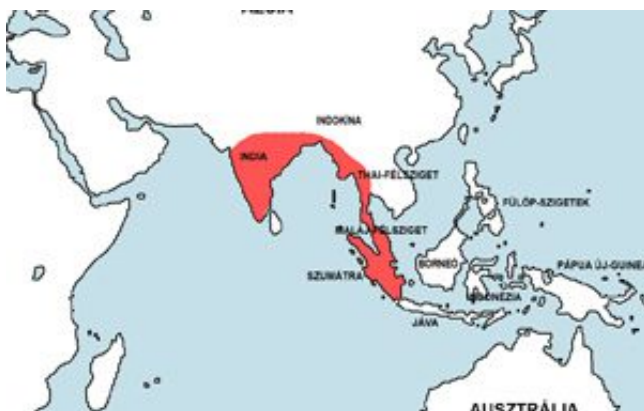
Chitala ornata – Bohóc késhal elterjedési területe (Map)