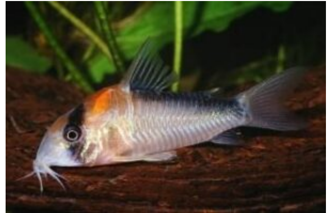
Corydoras adolfoi Adolfo páncélosharcsája (Burgess, 1982)