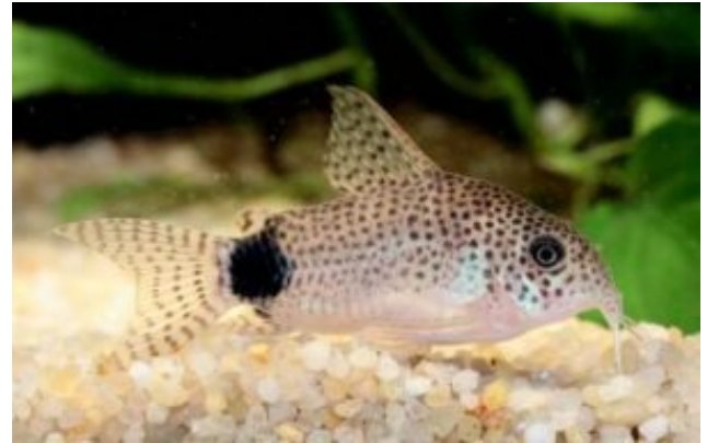
Corydoras caudimaculatus Farkfoltos páncélosarcsa (Rössel, 1961)