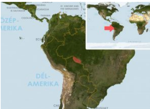
Corydoras caudimaculatus – Farkfoltos páncélosarcsa elterjedési területe (Map)