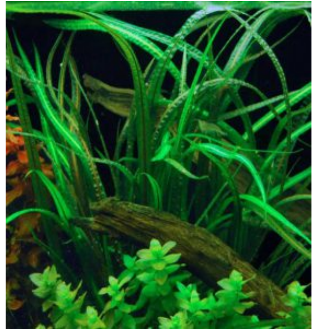
Cryptocoryne crispatula Hamis fodroslevelű vízikehely (Engler)