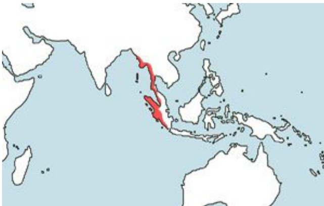
Danio kerri – Kék dánió elterjedési területe (Map)

A Bengáli-öböl szigeteinek és Thaiföld nyugati partvidékének folyóvizei.