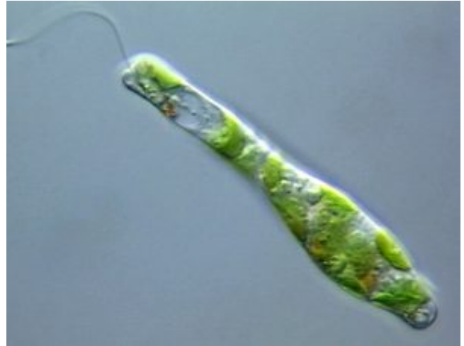
Euglena gracilis - ostorosmoszat

A halivadék számára ideális táplálék az Euglena (ostorosmoszat) nevű ostoros egysejtű.