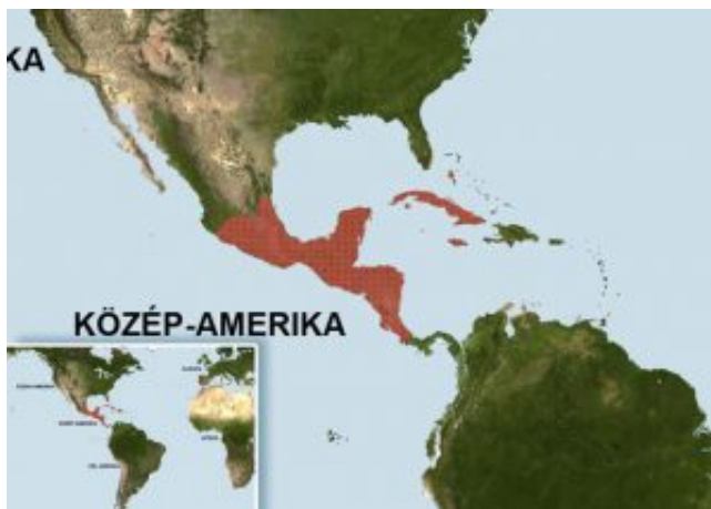
Gambusia puncticulata – Karibi gambúzia elterjedési területe (Map)

Közép-Amerikában elterjedt, megtalálható a Bahamákon, Kubán, Jamaicán és a Kajmán-szigeteken is.