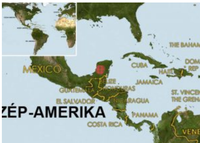
Gambusia yucatanana – Jucatáni gambúzia elterjedési területe (Map)

Először 1912-ben került Európába, ez a Mexikóban, főleg a Yukatan és Campeche vidékén előforduló gambúziafaj.