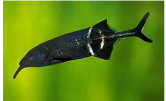
Gnathonemus petersii Elefánthal (Günther, 1862)