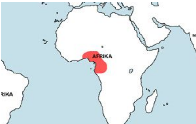
Gnathonemus petersii – Elefánthal elterjedési területe (Map)