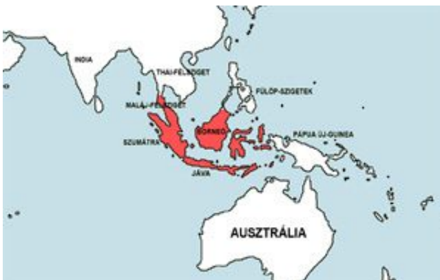
Striuntius lineatus – Sávós díszmárna elterjedési területe (Map)