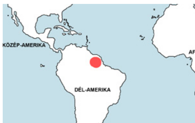
Hyphessobrycon heterorhabdus – Háromsávós pontylazac elterjedési területe