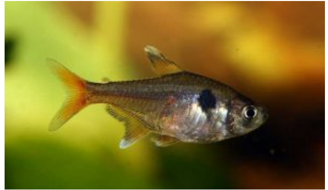
Hyphessobrycon roseus Sárga fantomlazac (Géry, 1960)