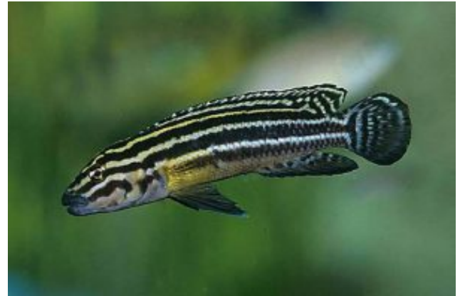
Julidochromis regani Négycsíkos torpedósügér (Poll, 1942)