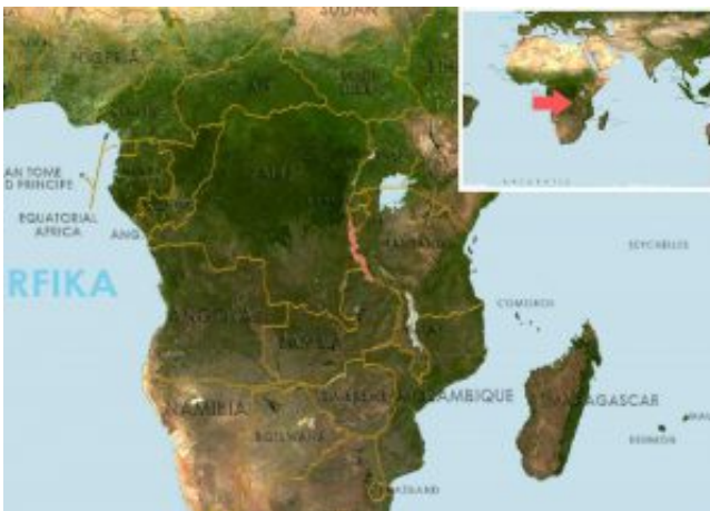
Julidochromis regani – Négycsíkos torpedósügér elterjedési területe (Map)