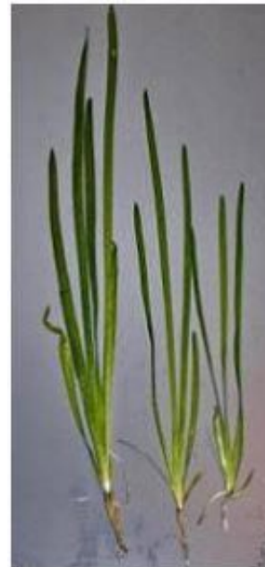
4. kép Vallisneria americana

Levelei keskenyek (legfeljebb 10 mm), szíjalakúak, közepesen hosszúak (50-100 cm) melyen 3-5 hosszanti ér található. Az átlós ereket véletlenszerűen terül szét az egész levélen. Ezek a növények Dél-Ázsiából származnak, ahol igen nagy mennyiségben fordulnak elő álló- és folyóvizekben. Könnyű és igénytelen növény kezdők számára, különleges igényei nincsenek sem a fény sem CO 2 terén, 20-28 °C-os széles hőmérsékleti-skálán jól növekszik. Könnyen, indák segítségével szaporodik.