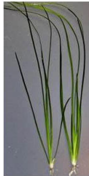
2. kép: Vallisneria nana Tropica No. 056C

A Vallisneriá k többnyire azokhoz a trópusi és szubtrópusi tájakon honos vízivénnyek családjába tartoznak, melyek képtelenek életben maradni, ha a meder, melyben élnek, a száraz évszakban kiszárad. Ezért, leginkább állandó vízben találhatjuk fel, ahol aztán nagy mezőket alkot. Vízivénny voltából szükségszerűen