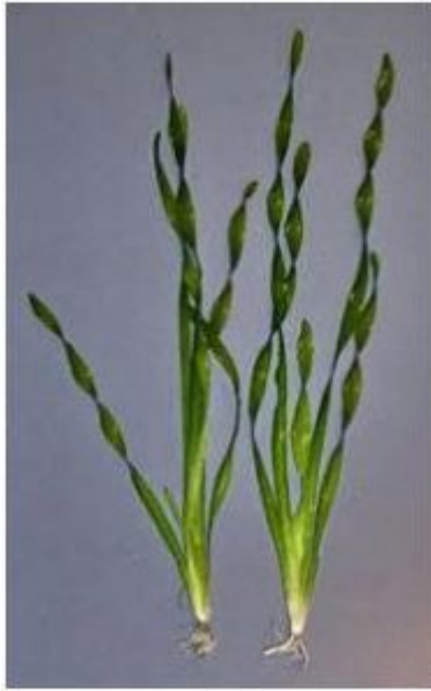
5. kép Vallisneria americana var. biwaensis Tropica No. 056