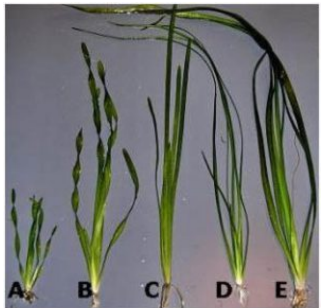
7. kép - A: Vallisneria americana "Mini Twister", B: Vallisneria americana var. biwaensis , C: Vallisneria americana "natans", D: Vallisneria nana og E: Vallisneria spiralis "Tiger"

Ennek a változatnak levelei keskenyek (3-5 mm), szíjalakúak, 5-50 cm hosszú, szépen fejlett hosszanti erekkel tagolt csavart formájúak. Ez a növény nagy akváriumban különösen vonzó látvány nyújt a középszint- vagy sík előtérbe ültetve. Ez a növény kicsit világosabb helyet igényel, mint a legtöbb Vallisneria típus, de más tekintetben, a víz keménységét és hőmérsékletét tekintve ugyanúgy igénytelen.