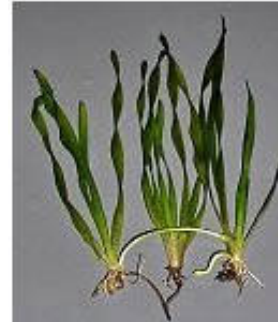
3. kép: Vallisneria americana "Mini Twister" Tropica No. 056B

Vallisneria nana (Tropica No 056C) a legújabb Vallisneria faj a Tropica nyilvántartásában. Láthatóan külön faj, mert sötétzöld levelei jóval keskenyebbek, mint a többi Vallisneria faj levelei, valamint a maximális levélhossz kissé rövidebb, mint a legtöbb más fajé. Ez a növény nagyon alkalmas a középszint növényesítésére, mert kevésbé nő sűrűn, mint a többi Vallisneria , de szintén jól használható kisebb akváriumok háttérnövényeként is. Természetes élőhelyein, melyek Észak-Ausztrália zavaros patakjaiban találhatóak, a Vallisneria nana levelei sokáig merevek maradnak és csak 15 cm-esre nőnek meg, míg a maximális levélhossz akváriumban 30-80 cm-es tartományban alakul, puhák és rugalmasak lesznek a levelei, valószínűleg a tápdús és világosabb körülmények okán. Gyors növekedésű, nem nagyon igényes, ezért jól érzi magát lágy és kemény vízben, és széles hőmérsékleti (20-28 °C) tartományban is. A Vallisneria nana szívesen indázik, erős gyökérrendszert fejleszt, és így hamarosan sűrű, tömör állományokat hoz létre az akváriumban. A tenyészetekben a növényt tartókosárba ültetik, és mielőtt eladják az üzleteknek, hagyják, hogy új gyökérhajtásokat neveljen a kertészetben, így a növény robosztusabb lesz, és jobban tud akklimatizálódni, amikor egy akvaristához kerül. Mindegyik kosár hat növényt tartalmaz, egy