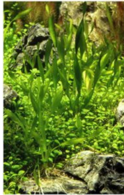
1. kép: Vallisneria americana "Mini Twister" az akváriumában, fotó: Jan Ole Pedersen

A Vallisneria összetéveszthetetlen a többi akváriumi növényvel, talán a Sagittariák hasonlítanak rá valamennyire, de azok is csak néhány morfológiai jellemzőjükben. A Vallisneriá nak szalagos levelei vannak, és a töindán fejlődő hajtásairól szaporodik. Ezenkívül jellemző, hogy a levelek kinézete minden fajnál feltűnően eltérő, és ez a változatosság, és az ebből következő különböző alkalmazási lehetőségek teszik ezt a növényt megfelelővé akváriumi tartásra. E levelek színezete a sötétzöldtől a sötétpirosig változhat, de a legnagyobb változatosság morfológiájában és maximális méreteiben figyelhető meg. A maximális hossz 10 centimétertől egészen a 180 cm-ig terjedhet, formája lehet sima és gömbölyded vagy lapos és széles fonákú. Ez utóbbi nagyon erőteljes, és ezért kitűnően megvan sügéres-akváriumában is, míg a kisebb típusokat előtérbe vagy közép-háttérnek használhatják fel, ahol szalagos és néha spirálisan csavarodó leveleik kitűnő kontrasztjai más növények levélformáinak.