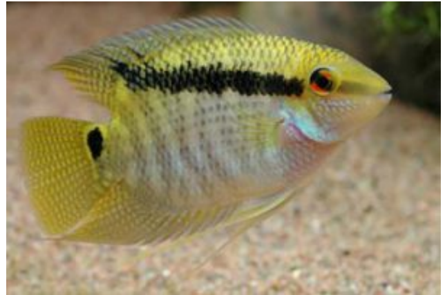
Mesonauta festivus Zászlós tarkasügér (Heckel, 1840)