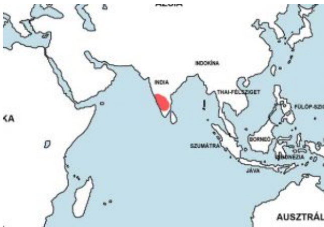
Neochela dadiburjori – Kéköves törpeponty elterjedési területe (Map)