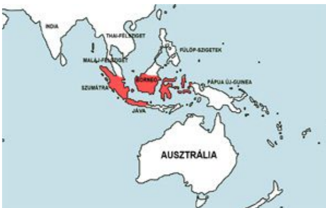
Olotius oligolepis – Nagypikkelyű díszmárna elterjedési területe (Map)