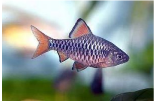
Olotius oligolepis Nagypikkelyű díszmárna (Bleeker, 1853)