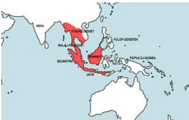
Osteochilus vittatus – Hasselt-Márna elterjedési területe (Map)