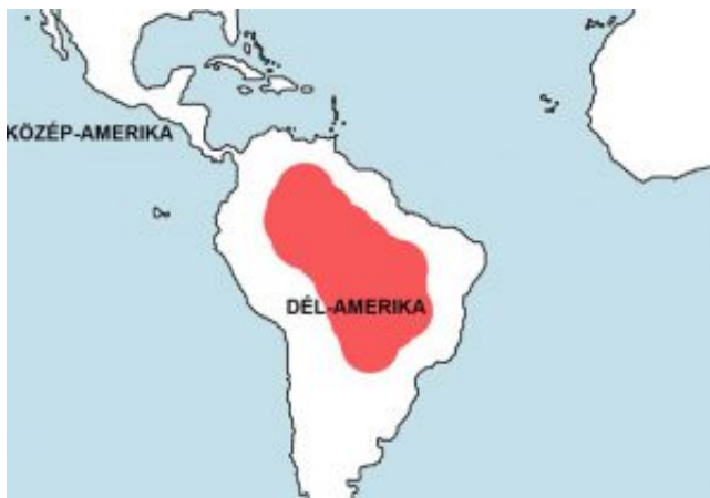
Otocinclus vestitus – Sujtásos szívóharcsa elterjedési területe (Map)