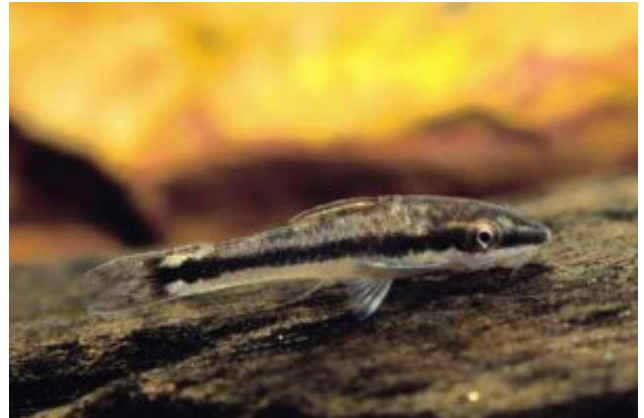
Otocinclus vestitus Sujtásos szívóharcsa (Cope, 1872)