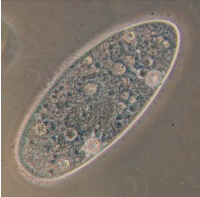
Paramecium caudatum - Papucsállatka