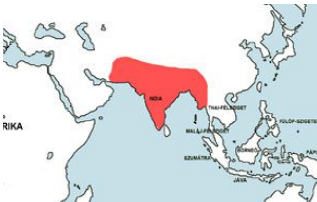
Pethia conchonius – Rózsás díszmárna elterjedési területe (Map)

Afganisztán, Pakisztán, India, Nepál, Mianmar folyóvizei.