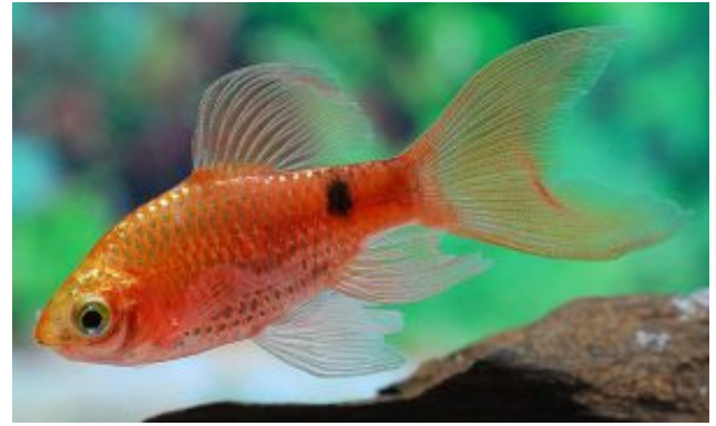
Pethia conchonius Rózsás díszmárna (Hamilton, 1822)