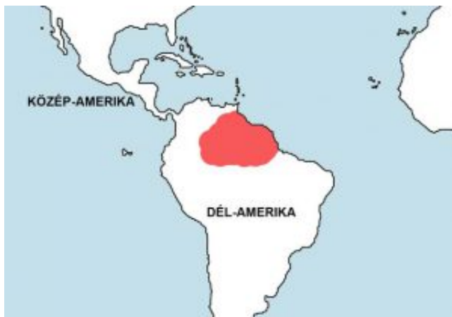
Pimelodus pictus – Dominóharcsa elterjedési területe (Map)