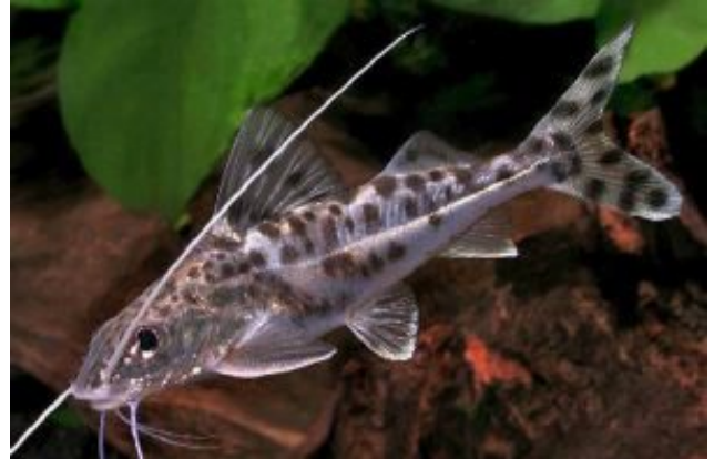
Pimelodus pictus Dominóharcsa (Steindachner, 1876)