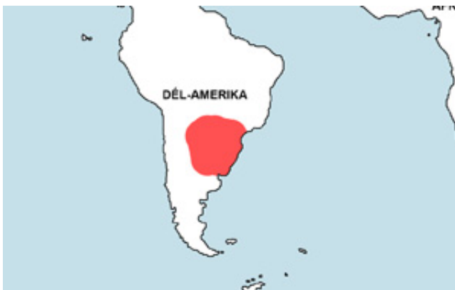
Pseudocorynopoma doriae – Sárkányszárnyú pontylazac elterjedési területe