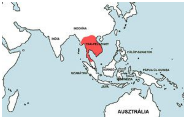
Rasbora borapetensis – Sziámi razbóra elterjedési területe (Map)

Elsősorban Thaiföld patakjai, de regisztráltak már több más helyről, így széles elterjedési területhez tartozik Laos, Kambodzsa, Vietnám, Malajzia, Indonézia, Borneó, Szingapur, Szunda-szigetek, Fülöp-szigetek, sőt, még Kína egy részén is elterjedtek!