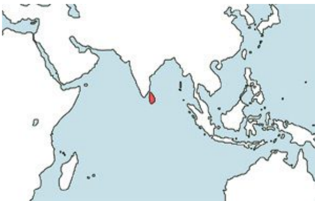
Systemus asoka – Asoka díszmárna elterjedési területe (Map)