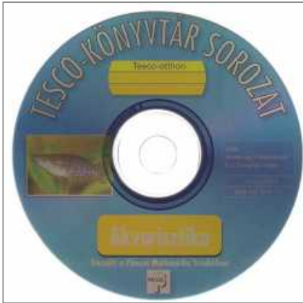
TESCO-OTTHON Akvarisztika CD- melléklet

Az állatkereskedés kirakatában vagy ismerősünk lakásán berendezett akvárium láttán vágyat érezhetünk arra, hogy otthon is élvezzük azt az érdekes és ugyanakkor végtelen nyugalmat sugárzó látványt, mit egy akvárium nyújt.