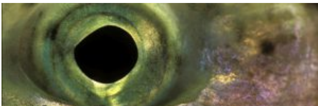
Michel Roggo természetfotóiból

A mintegy ötven fénykép és két kivetítés szinte élőben jeleníti meg a halakat, és mint kiderül, a tavak és folyók néha mesebeli hangulatát. Egyes jeleneteket Skandináviában, Szlovéniában és Horvátországban kapott lencsevégre, de a legtöbb svájci folyókból származik. Találékonyság és a türelem jellemzi Michel Roggo tevékenységét, miközben álomszerű képeken rögzíti a meglepő víz alatti tájakat, és a megvilágítás pillanatnyi változásait. A szokatlan formák, mélység, az átláthatóság, a fények, színek, mozdulatok, illetve mozgalmasság összezavarhat és gyönyörködtet, felszólítva minket, hogy őrizzük meg eredeti szépségükben a természet eme kincseit.